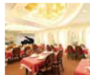
レストラン ロワール

駅前の市街中心地に位置し、交通の便もよく、各種大会、学会等の実績も多数。大小11ヶ所の宴会場を持ち、日本料理、中国料理、フランス料理の各レストランとステーキハウスがあり、充実した施設をご提供いたします。季節により地元ブランド野菜である「長岡野菜」を豊富に使うなど、地産地消を心がける料理は定評があり、長岡野菜を使ったレトルトカレーや「かぐら南蛮ジャム」など地域の特産品を使った商品開発なども手がけています。