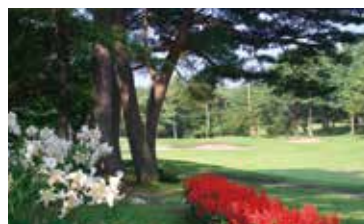
東コース8番ホール