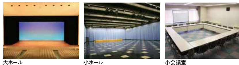
大ホール 小ホール 小会議室

日本一の大河信濃川の東側に位置し、新幹線の車窓からも見える白亜の建物、それが長岡市立劇場です。