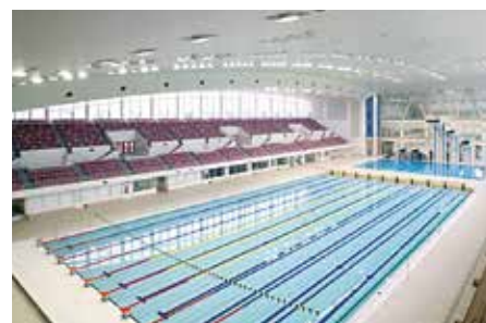
メインプール(50mプール・飛び込みプール)