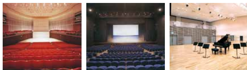
コンサートホール シアター 第1スタジオ

信濃川を望む長岡の文化情報の発信地・千秋が原ふるさとの森。その一角に、平成8年に誕生したのが長岡リリックホールです。ここでは、地域に根づいた文化活動の「創造の場」「発表の場」。長岡という地域の特性を生かした創造的な事業が展開される芸術・文化の拠点です。