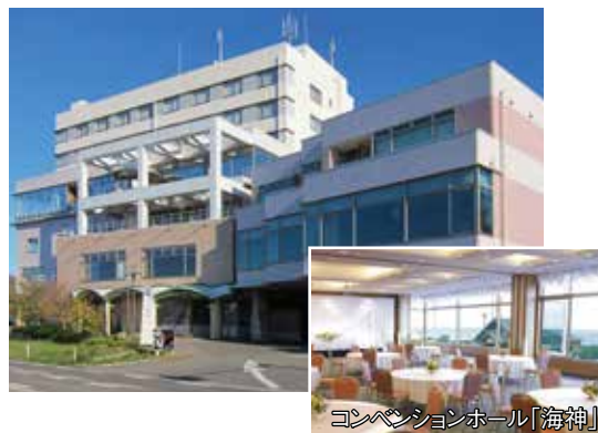
コンベンションホール「海神」