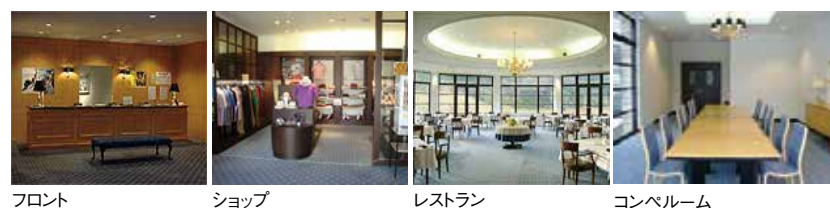
フロント ショップ レストラン コンパルルーム