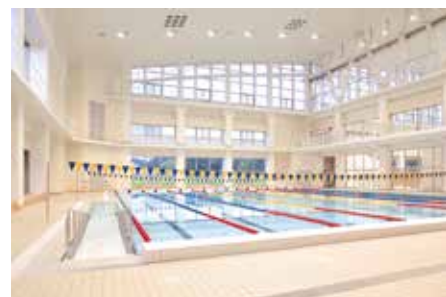
サブプール(25mプール)