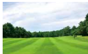
南コース1番ホール