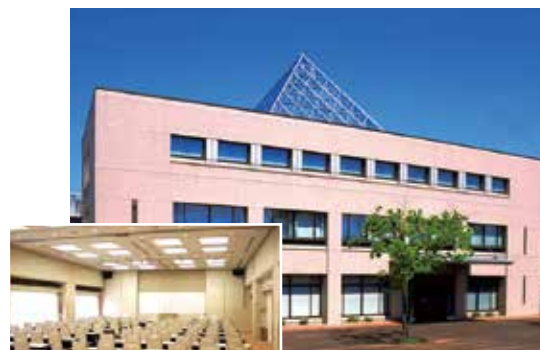
イベントホール「白鳳・天平」