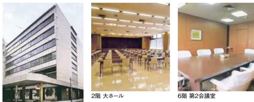
2階 大ホール 6階 第2会議室

JR長岡駅から徒歩数分と便利な場所に位置し、周辺は、小売・飲食サービス店が多く営業する大手通り、すずらん通り、殿町などの中心市街地となっています。