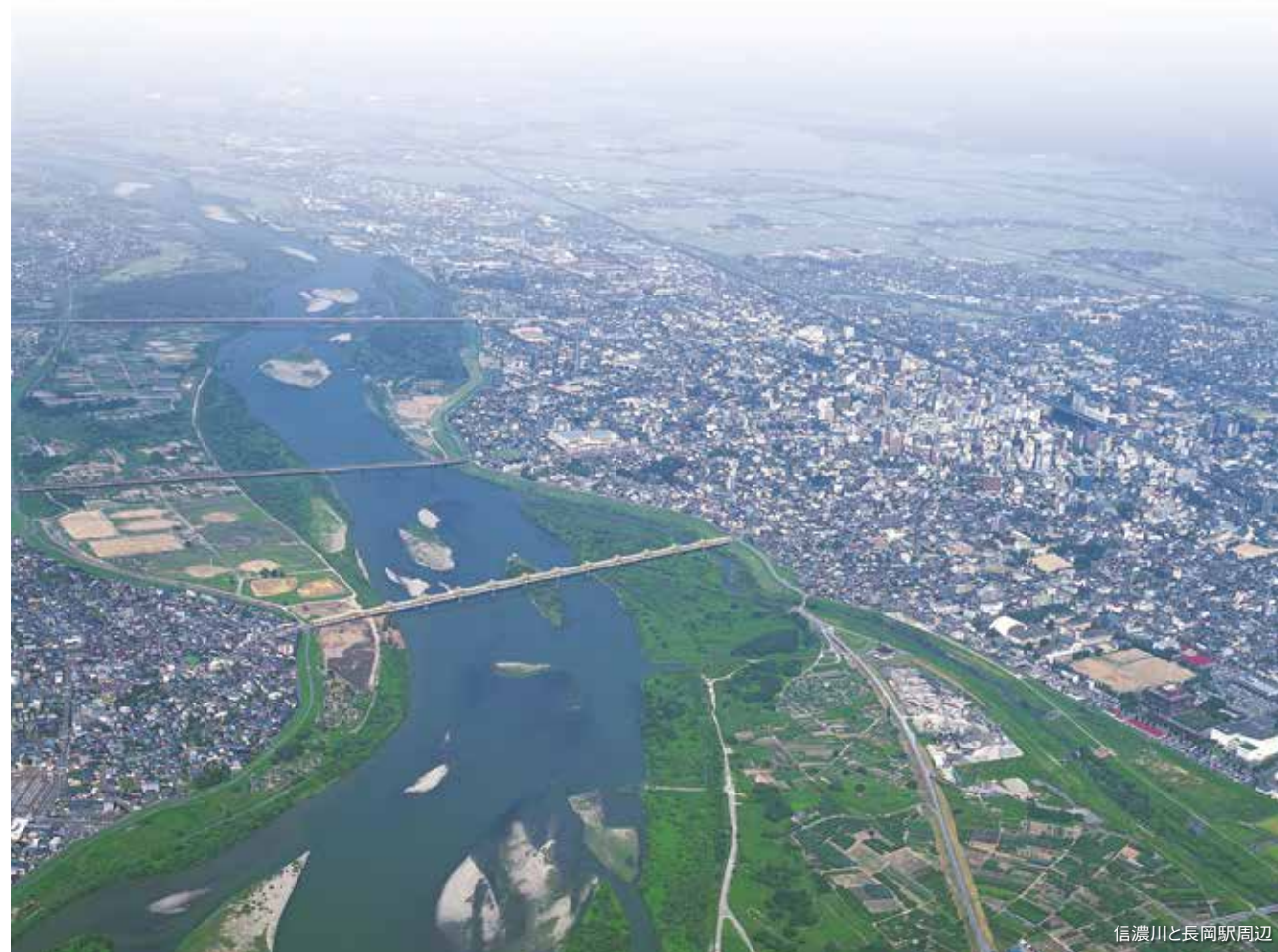
信濃川と長岡駅周辺