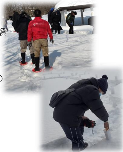
作業の様子（雪踏み、灯り設置）