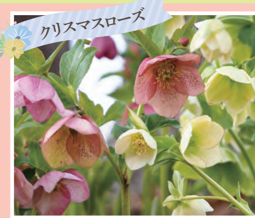
クリスマスローズ クリスマスローズ花壇 (3,000株) 開花:4月上旬~下旬 ※ウェルカムゲートから徒歩10分