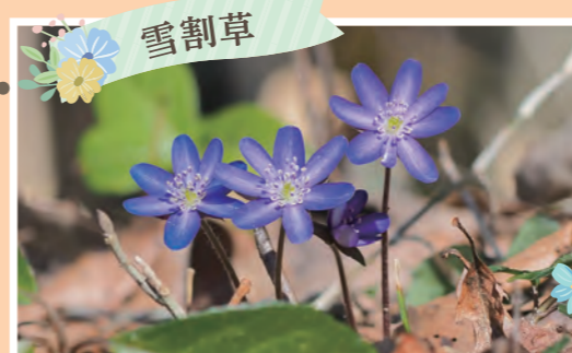
雪割草 雪割草群生地(23万株) 開花:3月下旬~4月中旬 ※ウェルカムゲートから徒歩15分