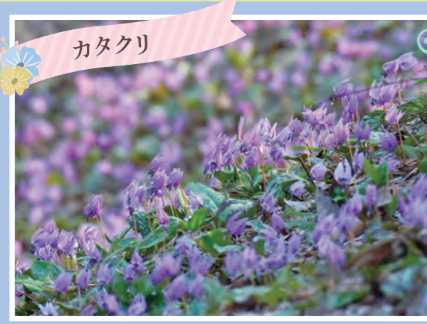
カタクリ カタクリ大群落 (100万株) 開花:4月上旬~中旬 ※里山駐車場から徒歩20分。 ※健康ゾーンから無料バス(土日祝のみ)にて古民家前下車(約20分)。バス停から徒歩10分。