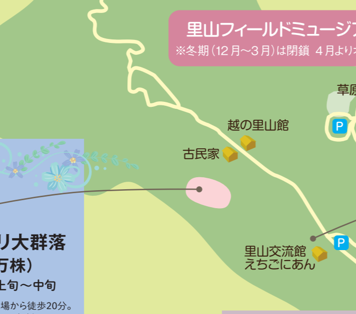
里山フィールドミュージアム ※冬期(12月~3月)は閉鎖 4月よりオープン