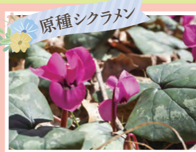
原種シクラメン 原種シクラメン(コウム) 開花:3月下旬~4月上旬 ※ウェルカムゲートから徒歩10分