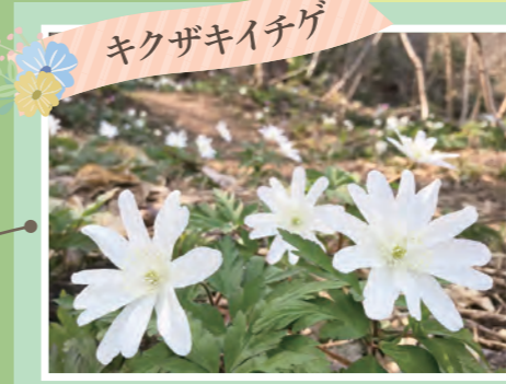
キクザキイチゲ 馬隠しの小径 キクザキイチゲ、カタクリ 開花:4月上旬~中旬 ※里山駐車場から徒歩3分。 ※健康ゾーンから無料バス(土日祝のみ)にて里山交流館えちごにあんに下車(約25分)。バス停から徒歩1分。