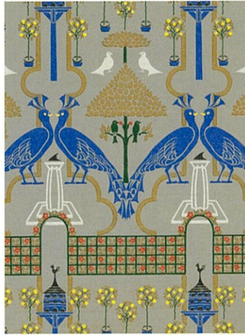
5. C. F. A. ヴォイジャー《地主の庭》1896年(デザイン)・1898年(印刷)