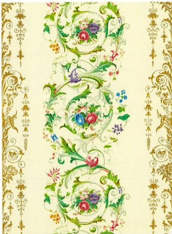
1.《花とロココ調スクロール》1850年頃