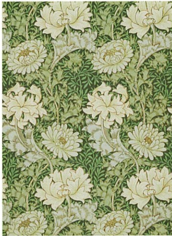
3.ウィリアム・モリス《クリサンセマム(きく)》1877年(印刷)