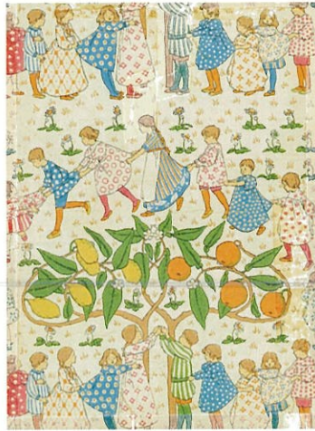
6. F. ロシー・セルトン《オレンジとレモン》1902年頃