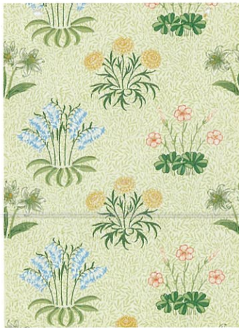
4.ウィリアム・モリス《リリー(ゆり)》1874年(印刷)