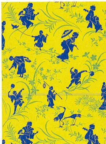
2.《日本風の影絵壁紙》20世紀初期