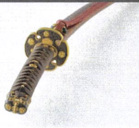
葵紋金具半太刀拵