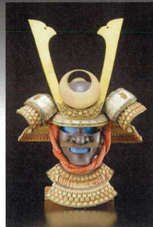
緋緋三十二間筋兜

「日本刀の美」は、日本美術刀剣保存協会(日刀保)長岡支部の協力のもと、平成20年から4年に1度開催し、このたび第5回目を迎えます。今回の主な作品として、鎌倉初期の「古一文字」、ゲームでも話題の「堀川国広」、大迫力の太刀身槍「同田貫上野介」、越後に関わりのある「桃川長吉」「栗原信秀」「和泉守兼定」「北越兼宗」「田村國守」「岩野道壽」、現代の「天田昭次・収貞」合作の剣などを展示します。また、市内和島地域の城之丘遺跡より出土した新潟県指定文化財の「毛抜形太刀」も併せて公開します。