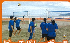
ビーチバレーボール