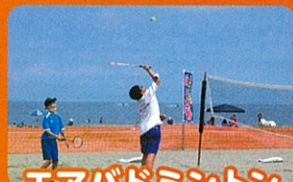
エアバドミントン