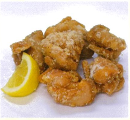
とりから 6個入 ジューシーで軟らかなとりから 500円(税込)