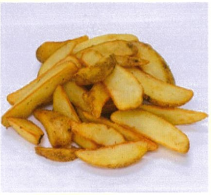
フライドポテト ホクホクとした厚切りのポテト 350円(税込)