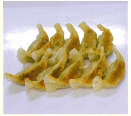
ぎょうぎ 10個入 里味手作りのもちりぎょうぎ 500円(税込)