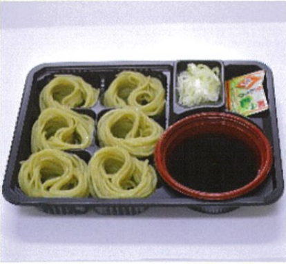
ざるそば 布のりで繋いだコシの強いそば 500円(税込)