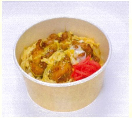
とりたま丼 とりから揚げを卵でとじました 500円(税込)