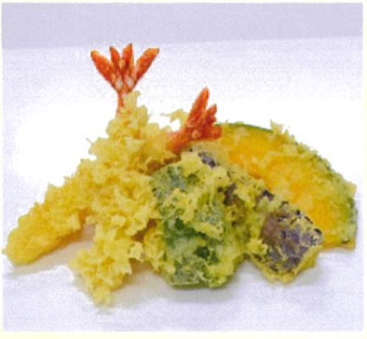
天ぷら 6品入 ごま油で揚げた香り高い天ぷら 500円(税込)