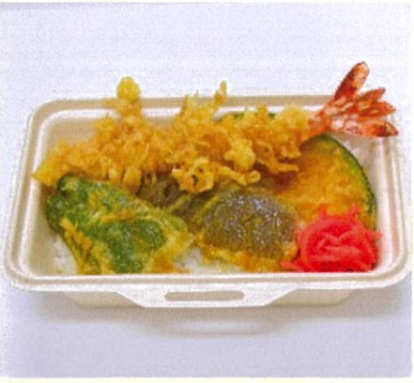
大えび天重 ごま油で揚げた大えび入り天重 700円(税込)