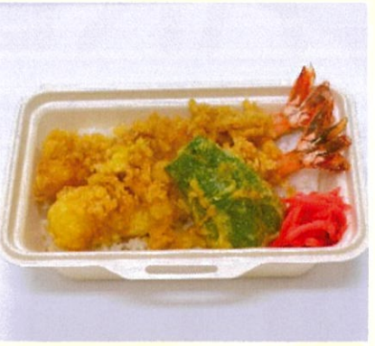
2本天重 プリプリの大えび天が2本入り 900円(税込)