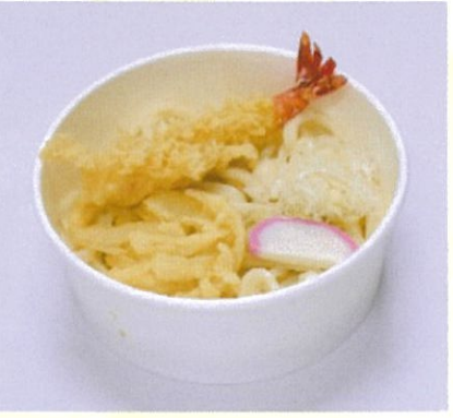
冷しえび天うどん ごま油で揚げたえび天入うどん 500円(税込)