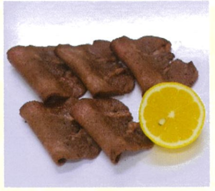
牛タン塩 5枚入 生ビールのおつまみに最高です 700円(税込)