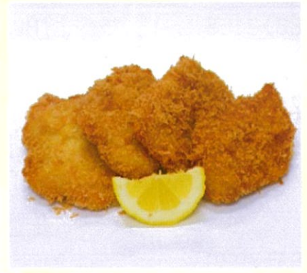
ひれかつ 4枚入 サクサクとしたやわらかひれかつ 500円(税込)