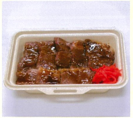
牛カルビ重 黒毛和牛だから甘くて軟らか 1,200円(税込)