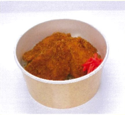
たれかつ丼 鰹と昆布の旨味を凝縮したタレ 500円(税込)