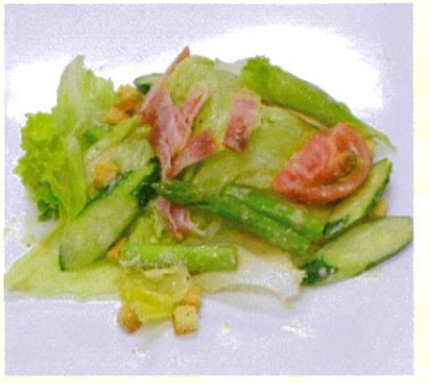
シーザーサラダ 自家製のシーザードレッシング 400円(税込)