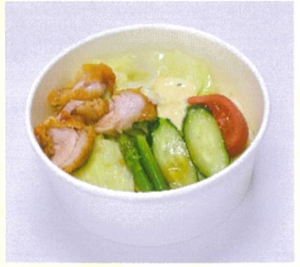
サラダうどん 紅花油仕立ての自家製タルタル 500円(税込)