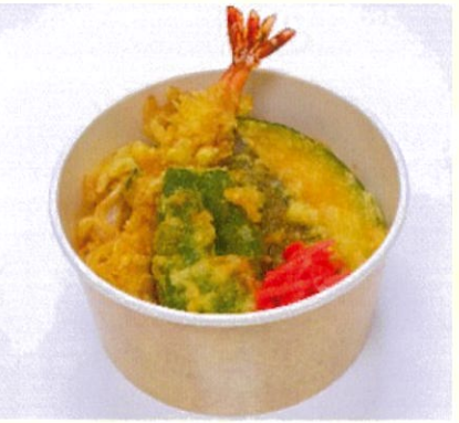
天井 ブルーツの旨味を凝縮したタレ 500円(税込)