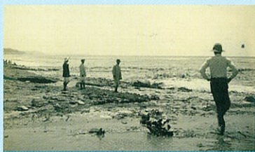
1922年の分水河口