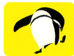
『ペンギんたいそう』2013 福音館書店