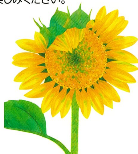
『さくよ さくよ』2016 福音館書店