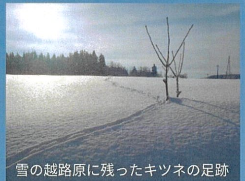
雪の越路原に残ったキツネの足跡

スノーシューを履いて里山を散歩します。 白銀の里山には、動物の足跡など 普段目にする事の出来ない不思議がいっぱい！ スノーシューをお持ちで無い方にはレンタルを ご用意しております。 冬の越路を楽しみましょう。