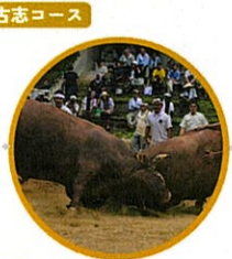
牛の角突き見学特別体験

★ココがSpecial (蓬平編) 不動社の火渡り神事では、神事の見学だけでなく実際に裸足になり火渡りが体験できます。