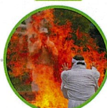
火渡り神事見学 火渡り体験