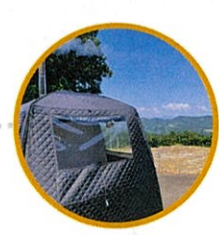
プライベートサウナ、温泉

★ココがSpecial (山古志編) 牛の角突きでは、闘牛と勢子を独り占めして闘牛と触れ合ったり、場内を一緒に歩いたりできます。