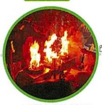
不動社 御護摩焚き