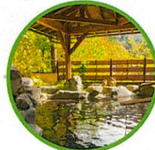
選べる泉質日帰り温泉

★ココがSpecial (蓬平編) 不動社の火渡り神事では、神事の見学だけでなく実際に裸足になり火渡りが体験できます。