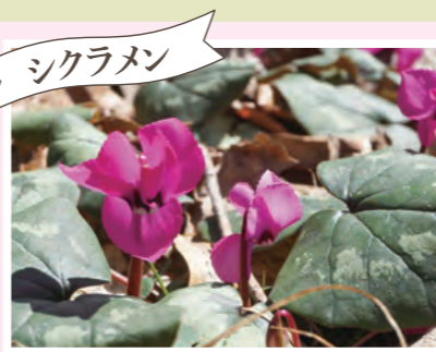
シクラメン 原種シクラメン(コウム) 開花:3月下旬~4月上旬 ※ウェルカムゲートから徒歩10分