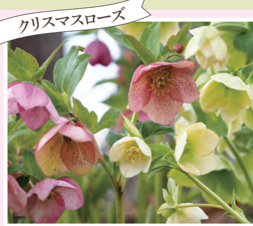
クリスマスローズ クリスマスローズ花壇 (3,000株) 開花:4月上旬~下旬 ※ウェルカムゲートから徒歩10分