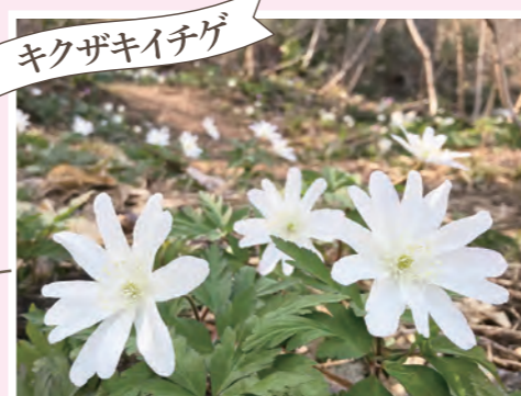
キクザキイチゲ 馬隠しの小径 キクザキイチゲ、カタクリ 開花:4月上旬~中旬 ※里山口駐車場から徒歩3分。 ※健康ゾーンから無料バス(土日祝のみ)にて里山交流館えちごにあん下車(約25分)。バス停から徒歩1分。