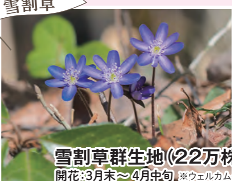
雪割草 雪割草群生地(22万株) 開花:3月末~4月中旬 ※ウェルカムゲートから徒歩15分